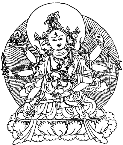
三頭八臂白色長壽佛