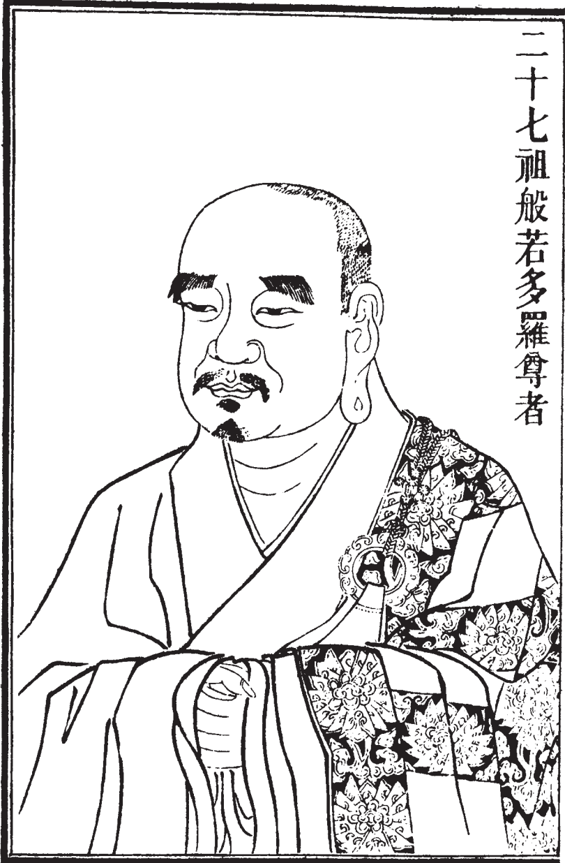
二十七祖般若多羅尊者