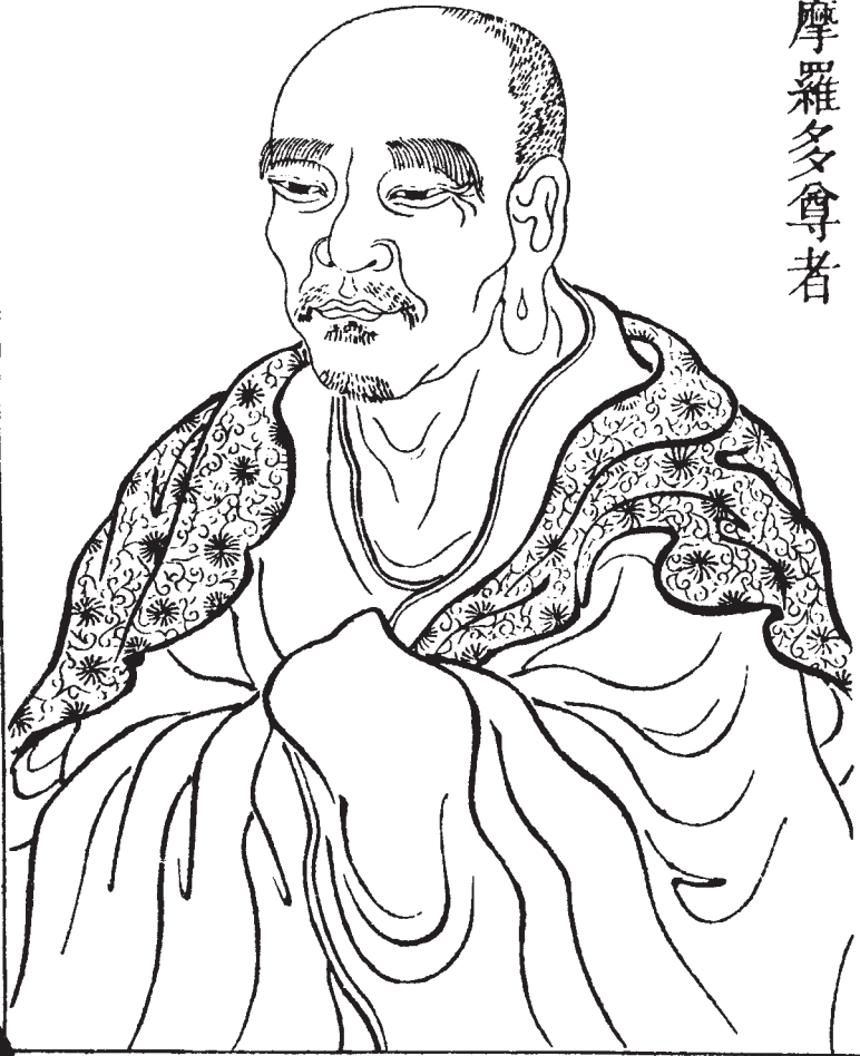
十九祖鳩摩羅多尊者